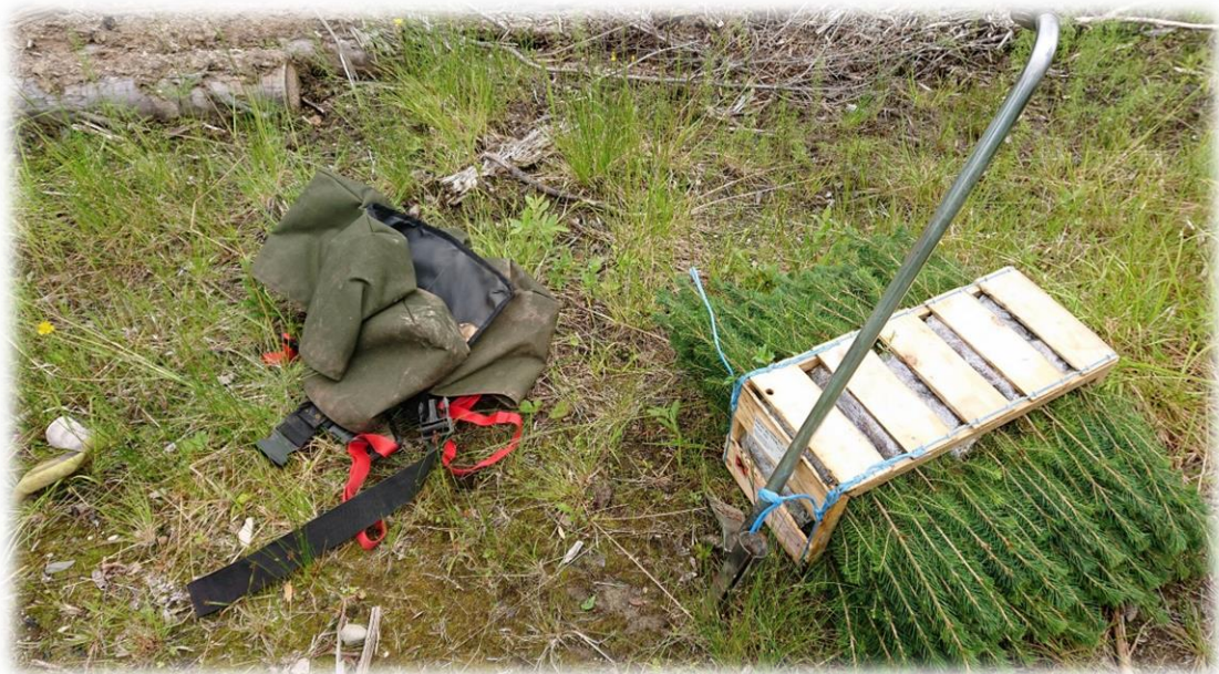
Figur 2: Klar til planting!

Tilskuddssatser fastsettes av Fylkesmannen.