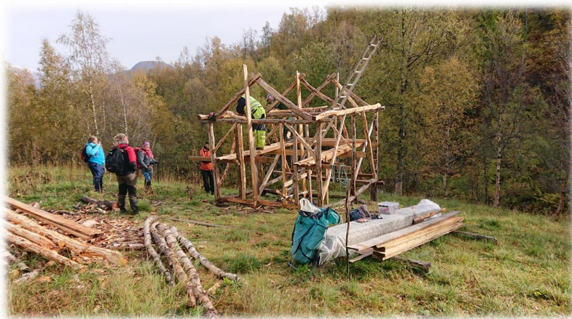
Figur 12: Sjytte under bygging i Kjelveik.