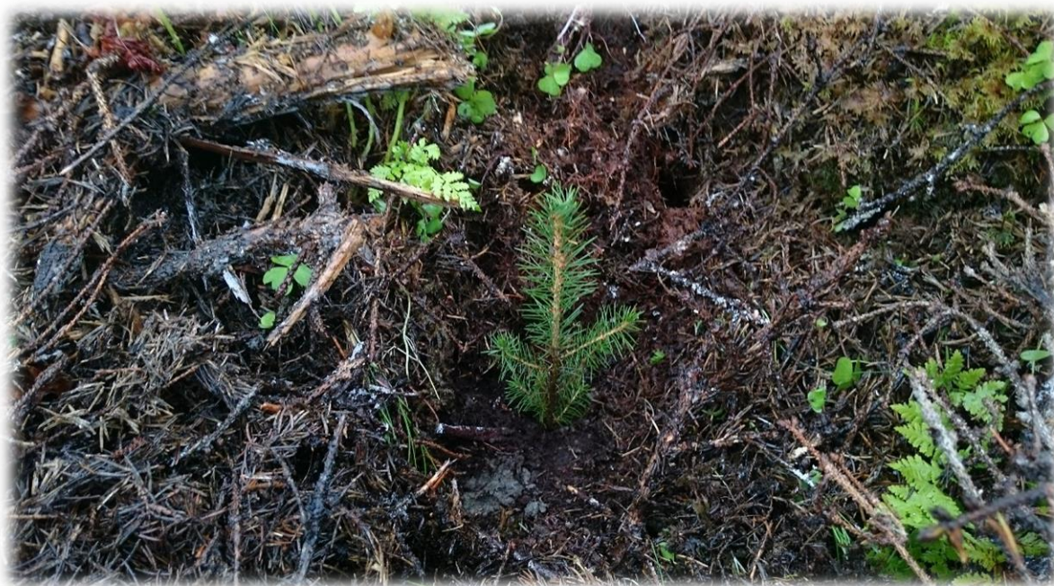
Figur 14: Nyplanting etter hogst.