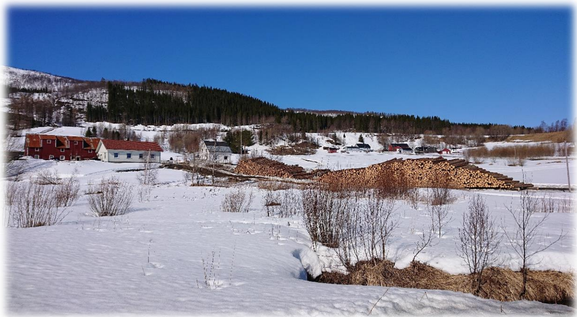
Figur 13: Hogst av plantefelt i Ånsvik.

Det er bygd en god del skogsveier i kommunen, men det er fortsatt et stort behov for veibygging, da en stor del av skogarealet består av et forholdsvis bratt og vanskelig terreng. Byggingen er dominert av traktorveier, pga. at det fremdeles er forholdsvis begrenset hogstvolum knyttet til veiene, med bjørkeskog og ung granskog. Det er ikke utarbeidet en hovedplan for skogsveier i kommunen. Et rasjonelt skogsveinett er en forutsetning for å kunne avvirke skogen på en lønnsom måte. Skogsveibygging kan komme i konflikt med miljø- og friluftsinnteresser, men skogsveier gjør også at utmarka blir lettere tilgjengelig for turgåere. Kommunene forvalter forskriften om godkjenning av planer for landbruksveger, og fra 01.01.2020 er også tilskuddsforvaltningen for skogsveier overført til kommunene. I forvaltningen av tilskuddsmidlene er det viktig å kanalisere midlene til de vegene som gir størst transportgevinst for skogbruket. Det vil i praksis si veier av bilveistandard og et ressursgrunnlag med granskog som enten er hogstmoden eller vil bli hogstmoden i løpet av en tiårsperiode.