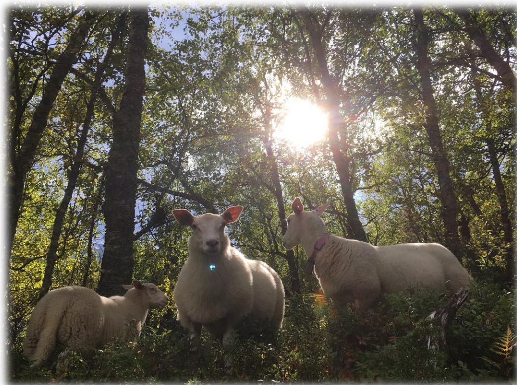
Figur 9: Sau på beite.

Sørfold kommunes utfordringer i jordbruket er ikke relatert til forurensingsproblem, men til gjengroing.