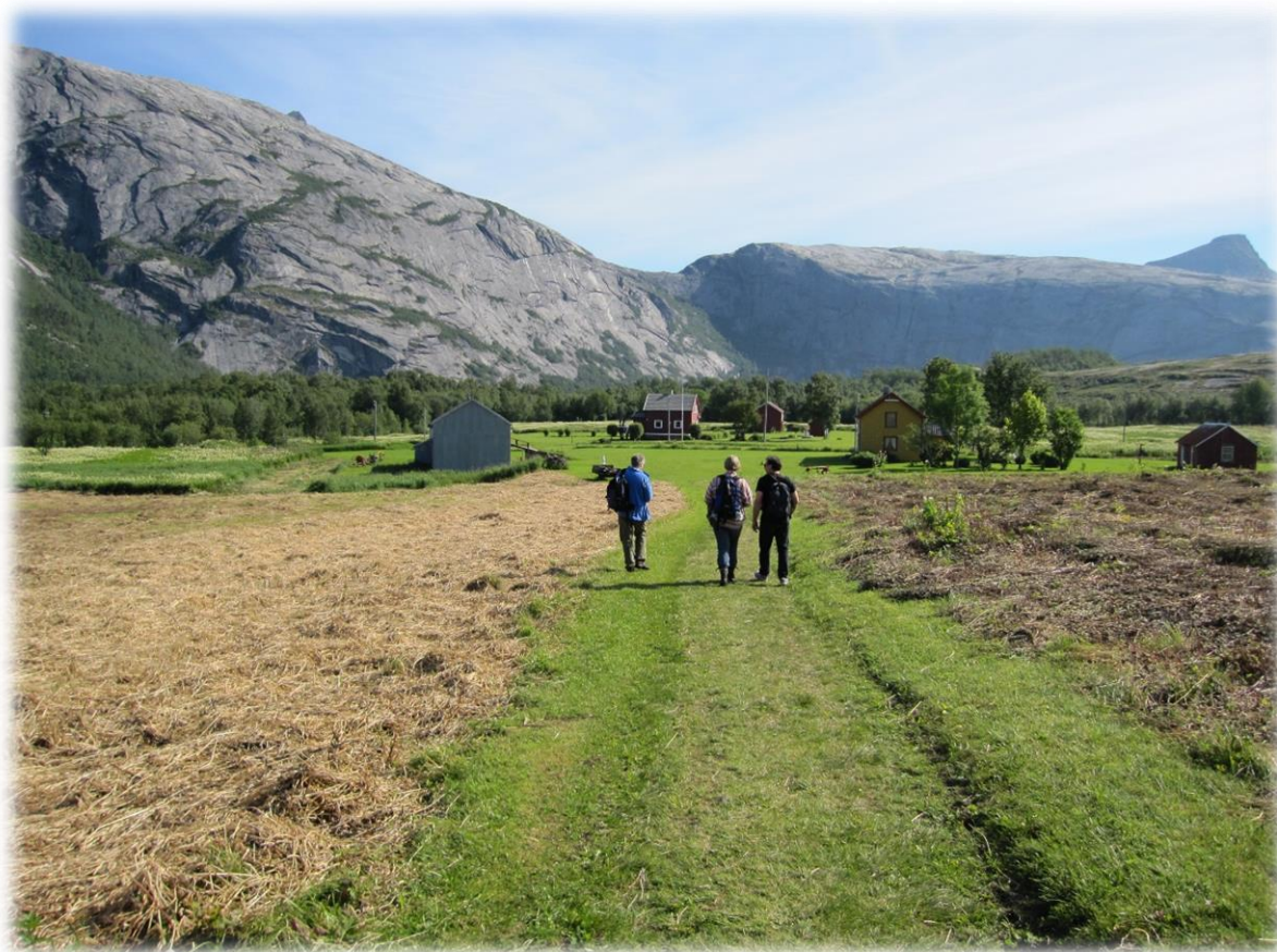
Figur 11: Rørstad

Dagens praktisering av konsesjon, driveplikt og deling av eiendommer ser ut til å ha en akkumulerende effekt for eiendomsstrukturen. En strengere praktisering av lovverk kan bidra til å hindre noe av utfordringene knyttet til eierforhold og fritidseiendommer.