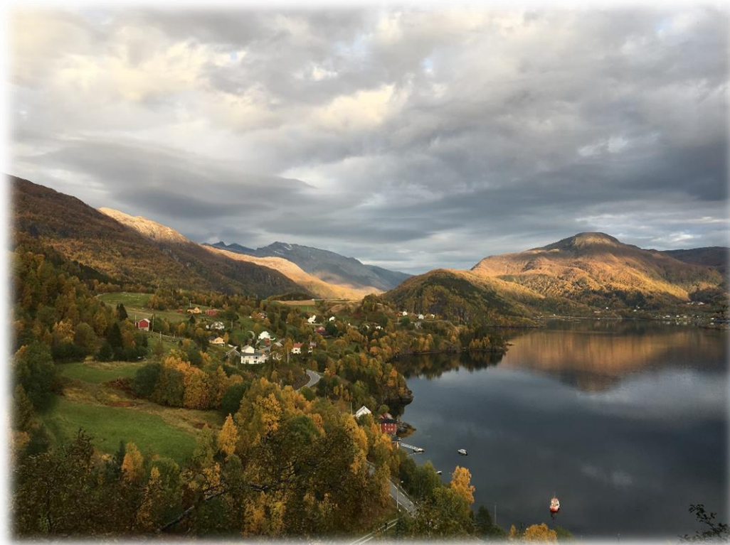
Figur 3: Engan-Ørnes.

Sørfold kommune ønsker å opprettholde et aktivt, variert og bærekraftig landbruk som i tillegg til mat- og virkesproduksjon, ivaretar kulturlandskapet og det biologiske mangfoldet.