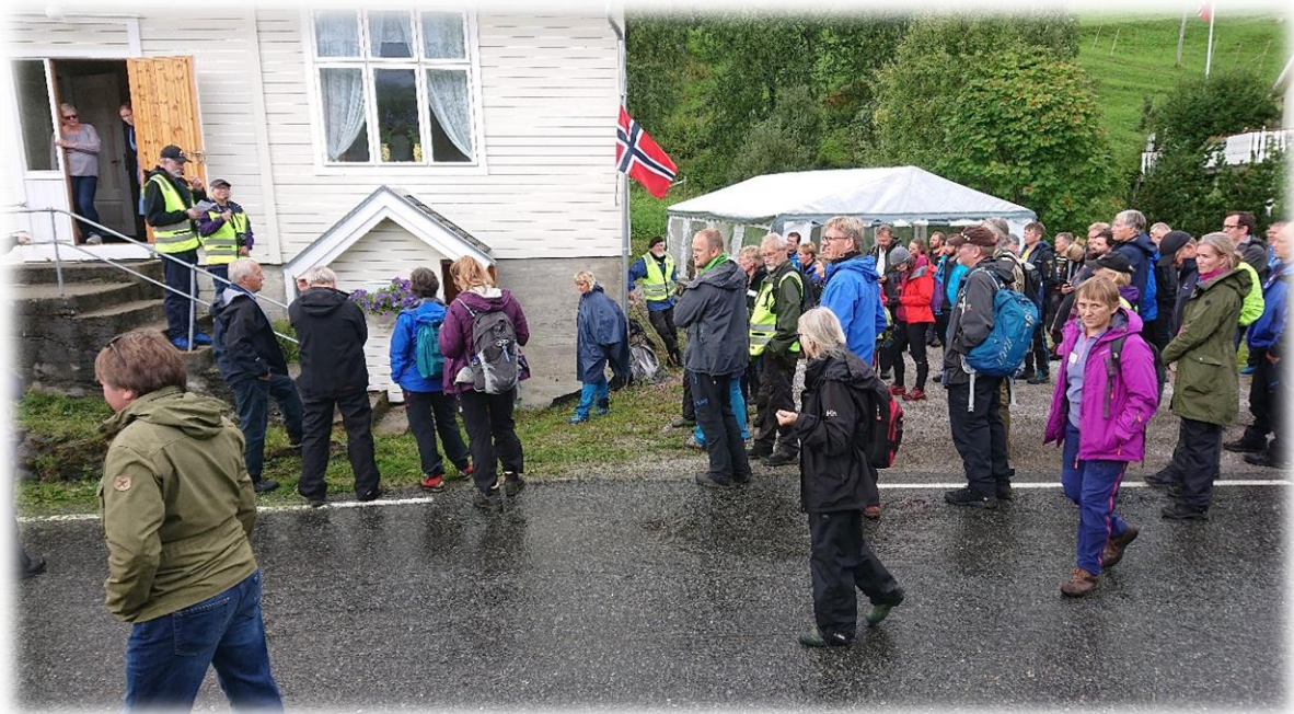
Figur 8: Utferdsdag i forbindelse med nettverkssamling for UKL-områder i 2018. Samling fremfor grendehuset på Engan.

Sørfold kommune overtok i 2020 forvaltningen av Utvalgt kulturlandskap i jordbruket fra Fylkesmannen i Nordland. Dette innebærer også forvaltning av de økonomiske virkemidlene knyttet til tiltaket. For 2020 utgjorde dette kr 850 000.