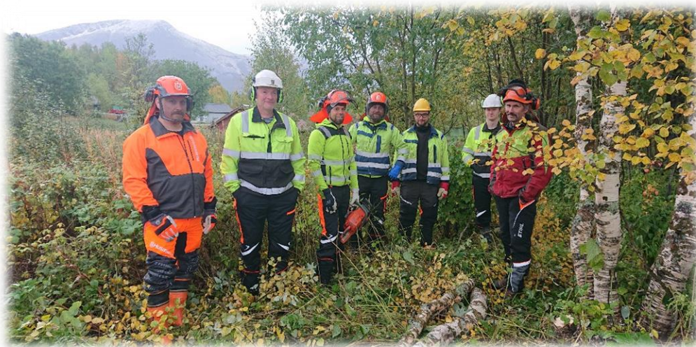
Figur 15: Aktivt Skogbrukskurs 2020.

Inntil 50% tilskudd av godkjent kostnad. Skal forhåndsgodkjennes av kommunen.