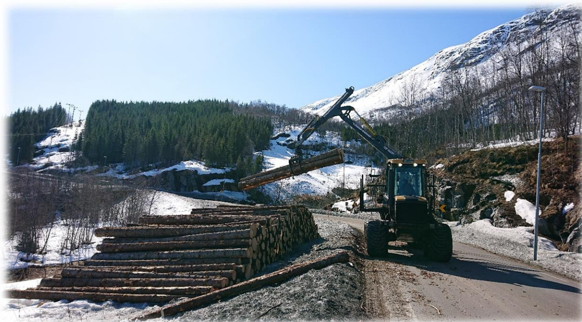
Figur 16: Lastbærer i sving i Ånsvik. Foto av Gerd Bente Jakobsen