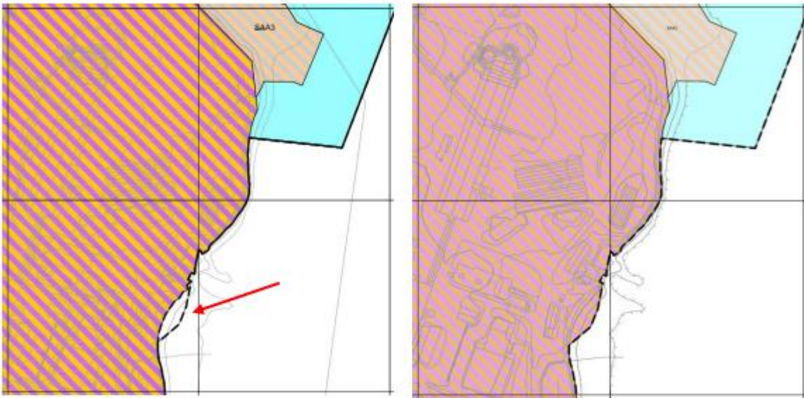
Figur 2: Utsnitt av gjeldende plankart (til venstre) og plankart til reguleringsendring (til høyre), hentet fra søknad.

Området som søkes innlemmet i plankartet er vist med svart stiplet strek i gjeldende plankart. Utvidelsen vil ha formålet BKB2, det samme som tilgrensede formål. Området som berøres av reguleringsendringen er avsatt til FFFN (Fiske-, ferdsel, friluftsliv- og naturområde) i kommunedelplan for Straumen, vedtatt 30.09.2010.