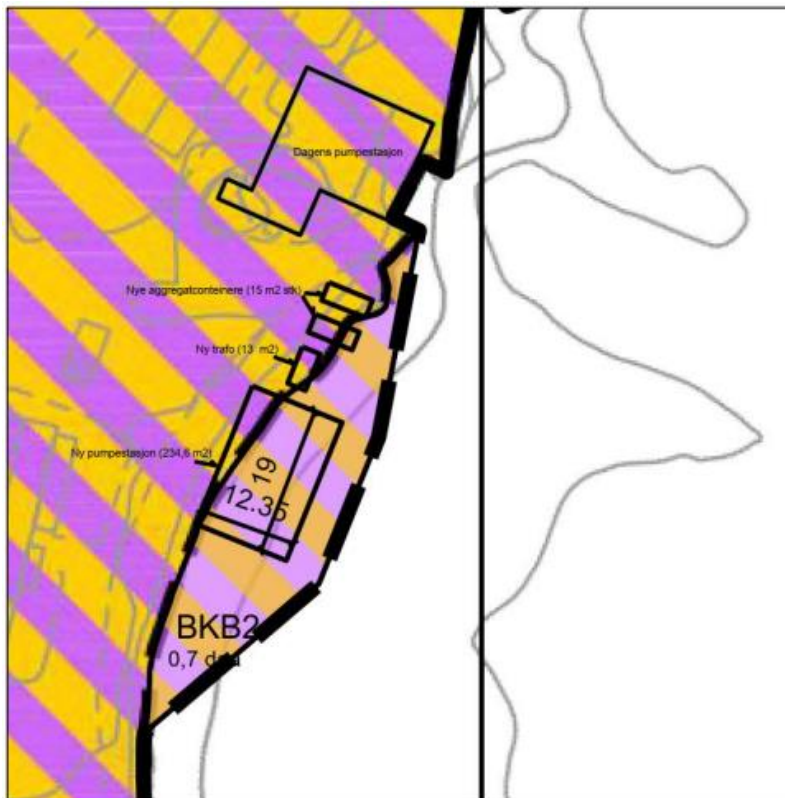
Figur 3: Illustrasjon med utsnitt av gjeldende plankart, reguleringsendring med planlagt ny bebyggelse og dagens pumpestasjon.

Området som søkes innlemmet i plankartet er vist med svart stiplet strek i gjeldende plankart. Utvidelsen vil ha formålet BKB2, det samme som tilgrensede formål. Området som berøres av reguleringsendringen er avsatt til FFFN (Fiske-, ferdsel, friluftsliv- og naturområde) i kommunedelplan for Straumen, vedtatt 30.09.2010.