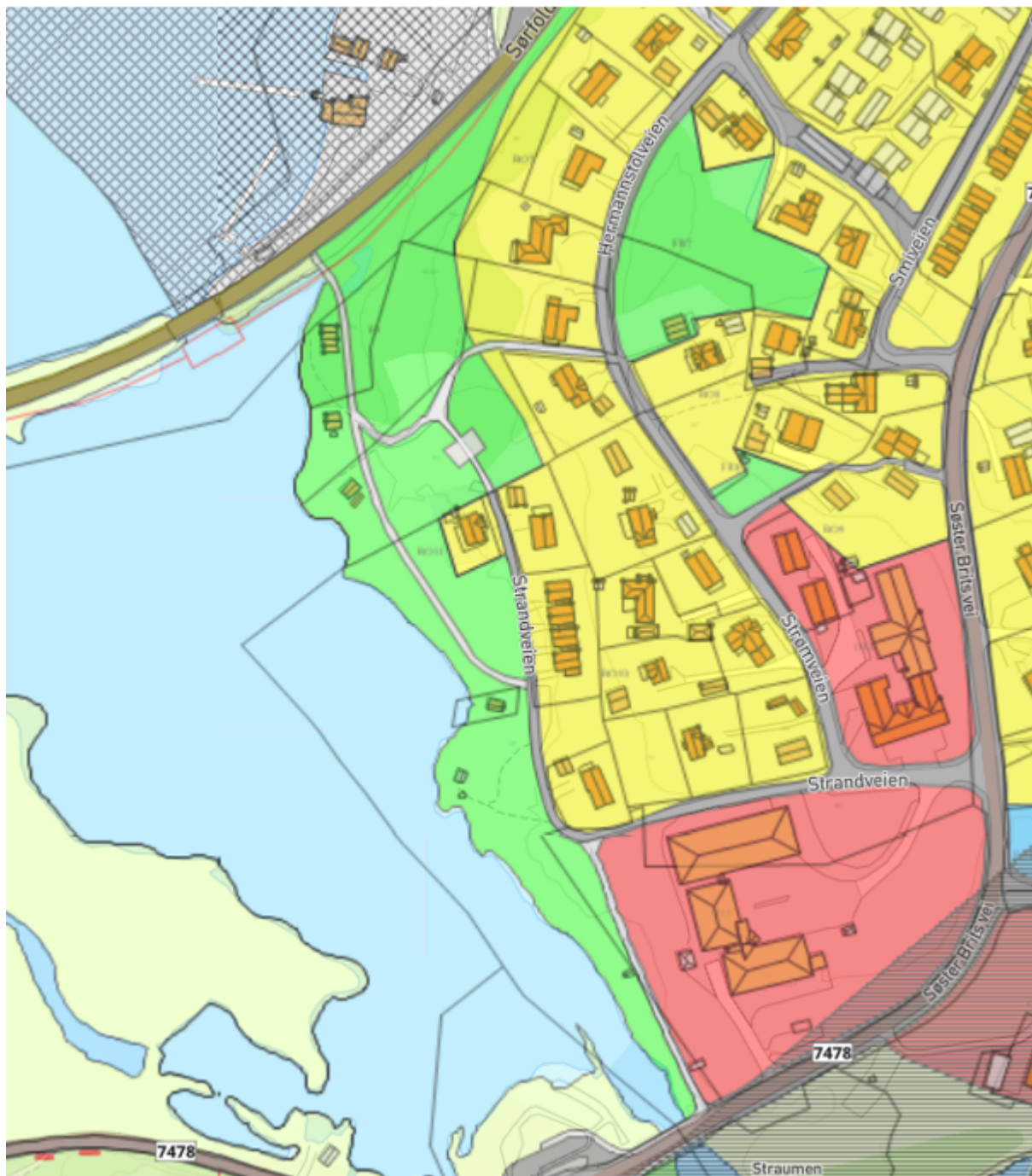
Figur 2: Utsnitt fra kommuneplanens arealdel, vedtatt 30.09.2010

planene, har KPA retningsgivende virkning inntil revisjon av planene er aktuell. Gjeldende plan Straumen 1 vest er ikke i samsvar med KPA hva gjelder arealbruk. Dette kommer frem på figur 2: