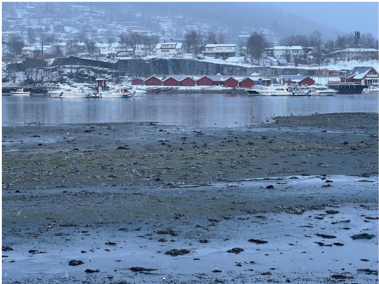
Figur 6: Figur 7. Mudderfjæra 28 april med stor aktivitet av beitene hekkemåke