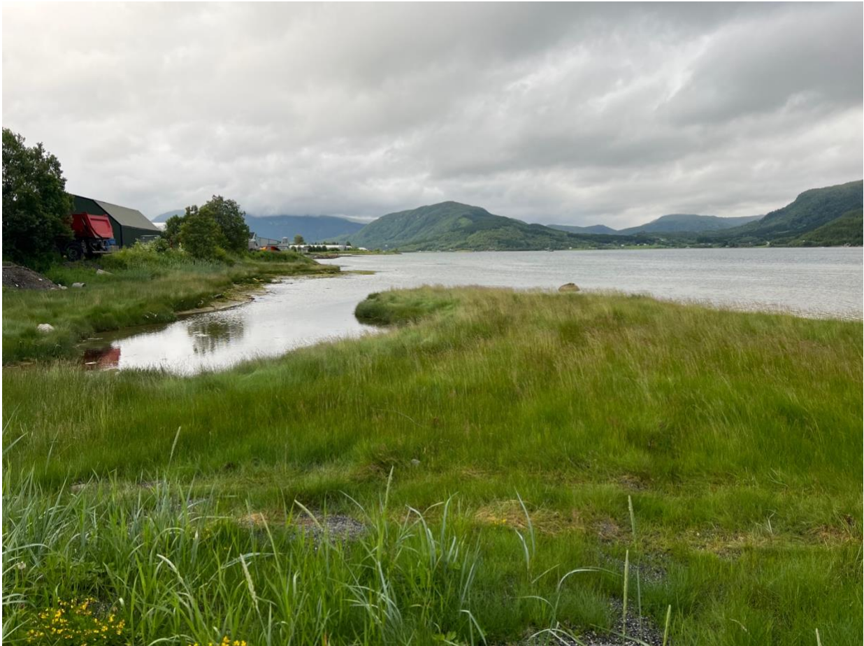
Figur 6. Strandenga i området

Strandenga har tidligere trolig hatt et større areal (før utfylling av området). Tilstanden vurderes til å være god, da den ikke har omfattende skader. Naturmangfoldet vurderes å være lite med lite areal og forekomst av relativt få habitatsspesifikke arter. Ingen rødlistearter ble registrert. Totalt sett vurderes strandenga å ha moderat kvalitet.