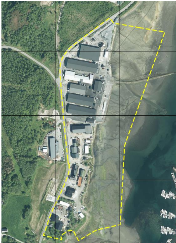
Figur 2: Kartet viser avgrensingen til planområdet, angitt med gul stiplet linje.