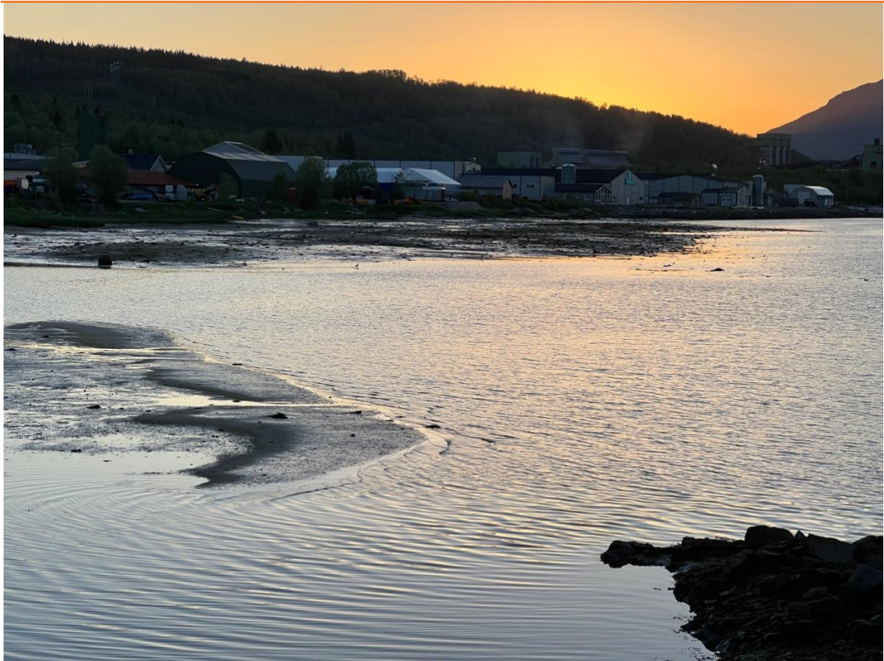
Figur 7: Området sett fra E6 mot vest 08 juni med sandlo og grønnstilk aktivt beitende .