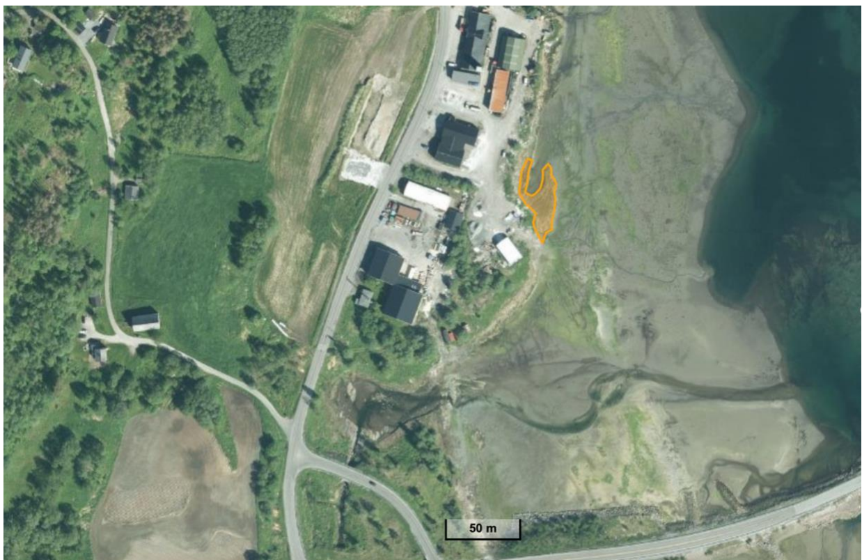
Figur 5: Lokalisasjon av naturtypen som er registrert innenfor planområdet (rød avgrensing)

Under feltbefaring ble det registrert en naturtype en liten strandeng med areal på 650 m 2 etter miljødirektoratets instruks; strandeng (VU -truet naturtype). Lokalisasjon av naturtypen er vist i figur 6.