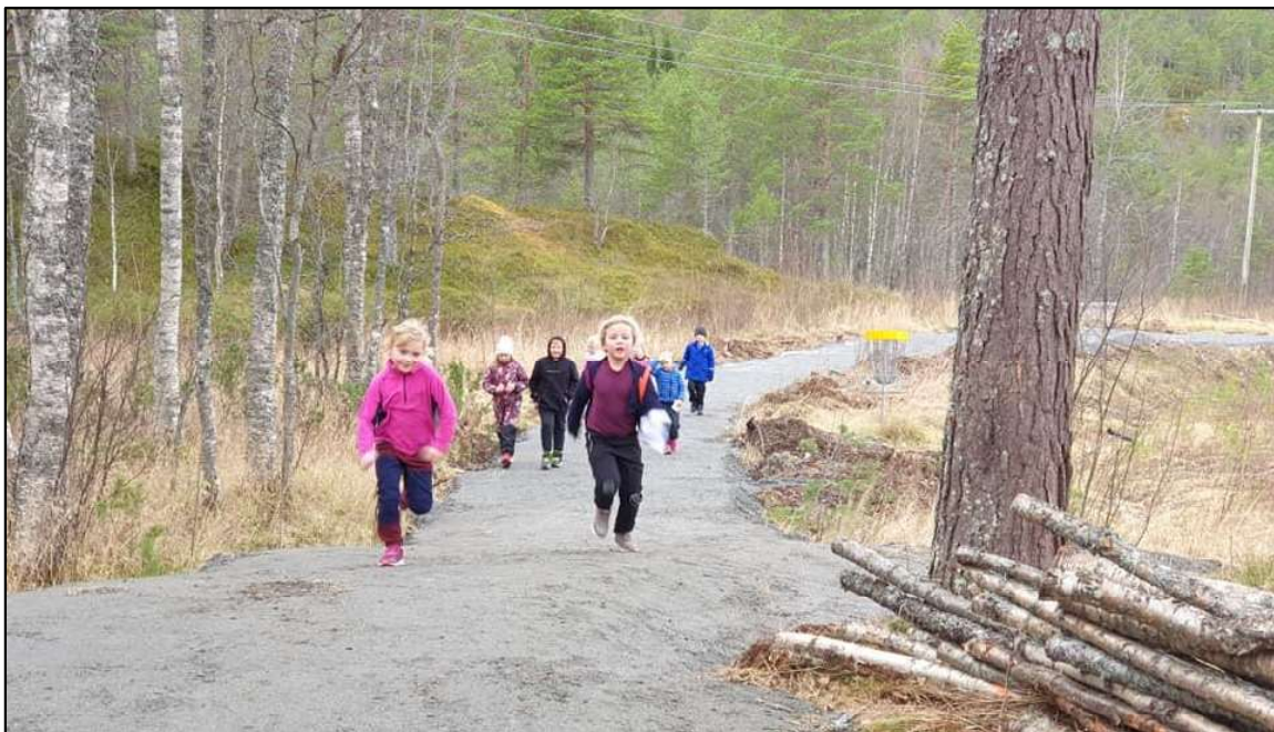
Den nye sykkelløypa ble tatt i bruk høsten 2021. Den er også fin å løpe i, som her da elevene løp til inntekt for TV-aksjonen.

Skolen føler seg heldig som har fått et meget godt fungerende FAU å samarbeide med. De har kjøpt utetennisbord og deltar i videre utvikling av uteområdet på skolen. Vi regner med at handlingsplan for uteområdet blir lagt inn i kommunedelplan slik det står i premissene.