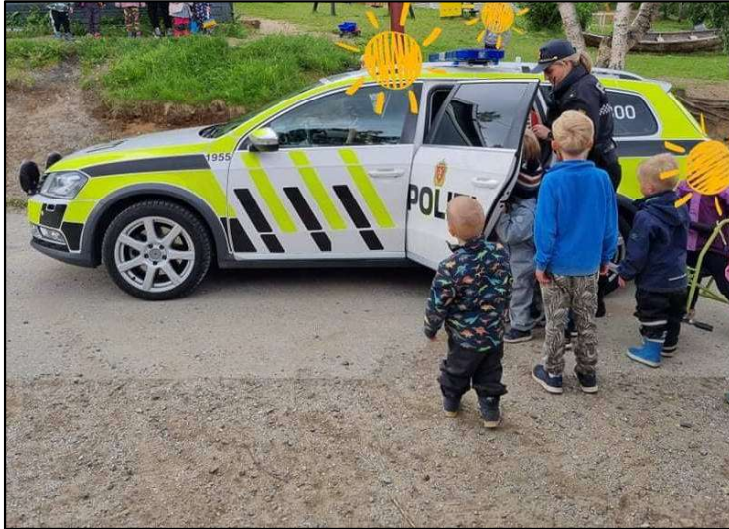
Politiet på besøk.

26. mars ble ansatte, barn og foresatte satt i karantene til 10. april pga. smitte i barnehagen. Viktige beskjeder kom på kort varsel, da vi måtte vente på tilstrekkelig oversikt over situasjonen lokalt før vi visste resultatene av covid-19 testene som ble foretatt i den perioden. Barnehagen ble smittevasket og gjort klar til åpning. All ære til alle som sto i dette.