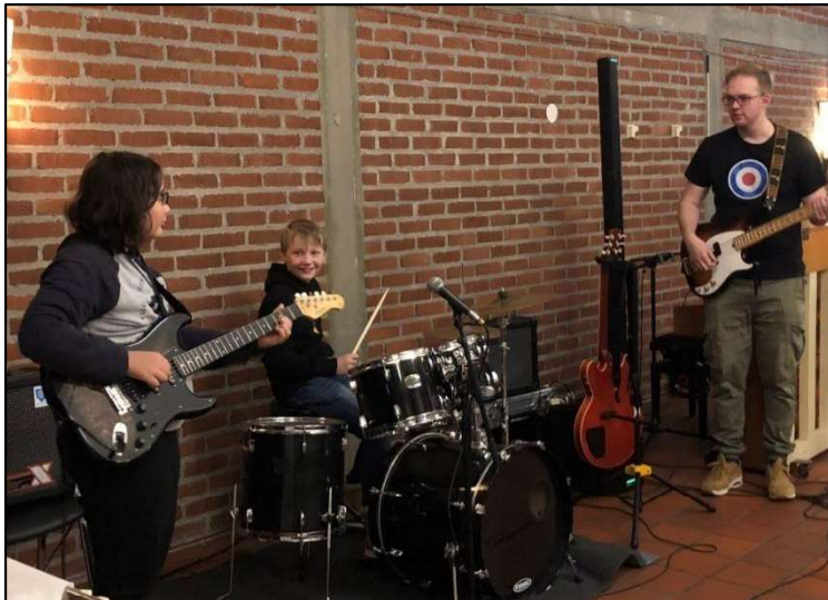
Høstløvkonsert på Kobbelv vertshus.

Helse, samspill og livsglede på Sjøfold eldresenter i samarbeid med Straumen barnehage har ikke vært i drift i 2021 p.g.a. koronarestriksjoner. Det samme gjelder «gylne øyeblikk» på Sjøfold sykehjem.