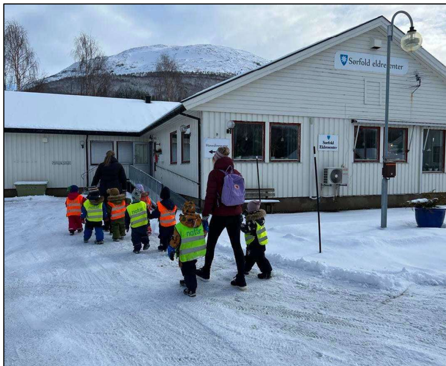
Barnehagen kommer på besøk.