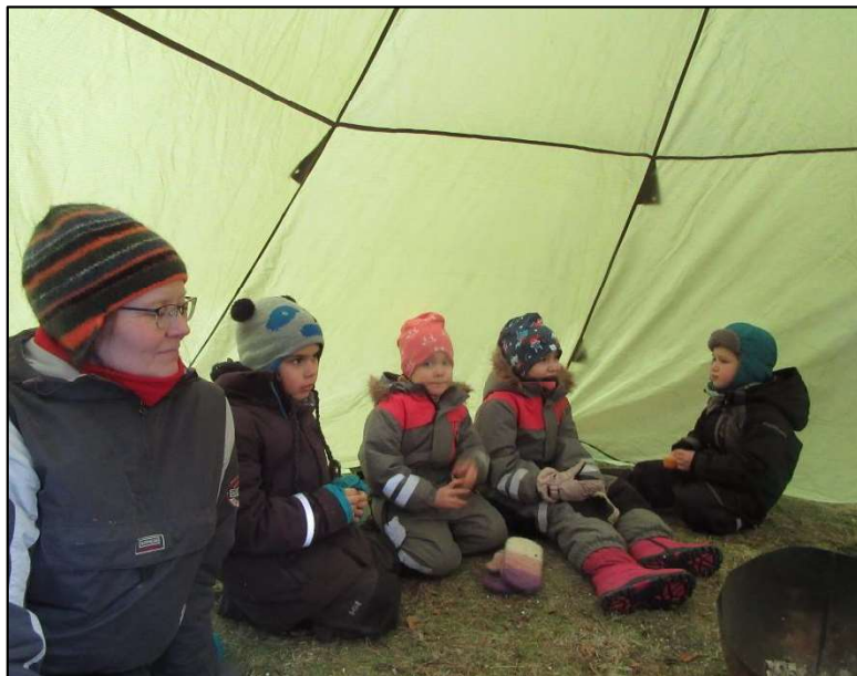
Fortellerstund i lavvoen

Alle gjør sitt til at Nordsia oppvekstsenter skal være en trygg og trivelig plass å være, og der barn skal ha et godt utbytte, faglig og sosialt, både i barnehage og i skole.