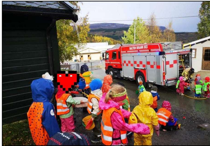
Populært med besøk av brannbilen.

Vi har benyttet oss av hallen på skolen, en veldig fin plass for barna å få boltre seg på. Bjørnis kom i brannbilen på besøk til oss, helt fantastisk moro for de små. Vi har vært på turer i Seljåsen, Harlifjellet, Helland og i nærområdet. Vi har forsket og hatt mye vannlek. Vi trener på selvstendighet og har jobbet med relasjonsbygging. Vi har hatt mange forskjellige spennende aktiviteter på alle avdelingene og sammen, og vi har leken i fokus i Straumen barnehage. Latter og glede står sterkt hos oss.