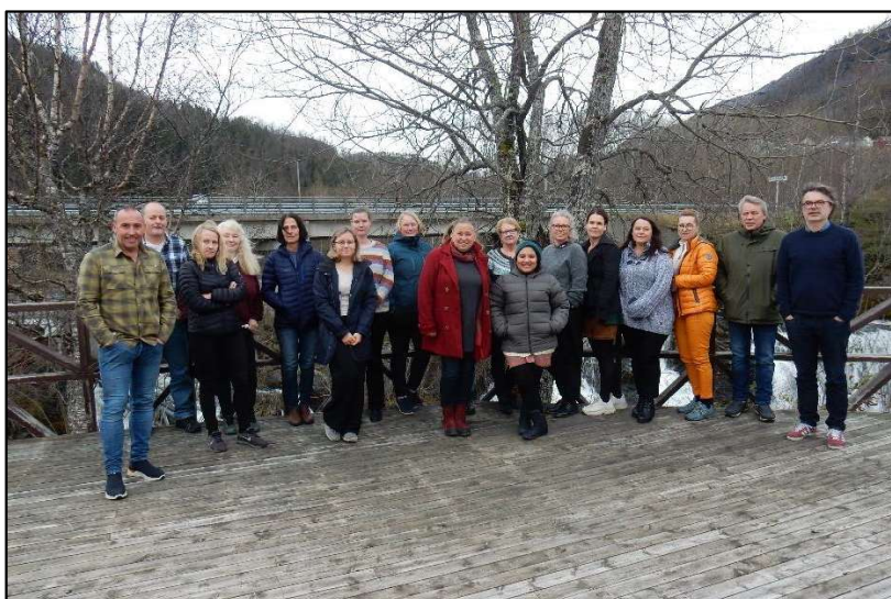
Samling for reiselivsbedrifter i oktober på Kobbelv vertshus.

Det ble fattet vedtak om kjøp av tjenester i forbindelse med turistinformasjon og offentlig toalett for i alt kr. 74 000 til fire bedrifter, med midler fra næringsfondet.