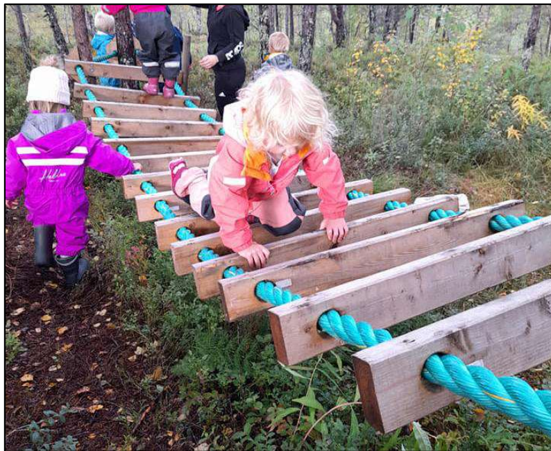
Spennende med ny klatrejungle.

Vi jobber med realfag, som er i tråd med realfagssatsningen til Sørfold kommune. Barnehagen skal igjennom 4 moduler i løpet av et barnehageår, men på grunn av Covid-19 ble noen av modulene ikke gjennomført. Barna som går over i skolen får med seg sine realfagspermer, som følger dem ut 10. klasse.