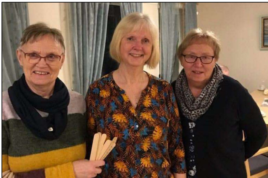
Frivillige i Sørfold demensforening gjør en uvurderlig innsats.