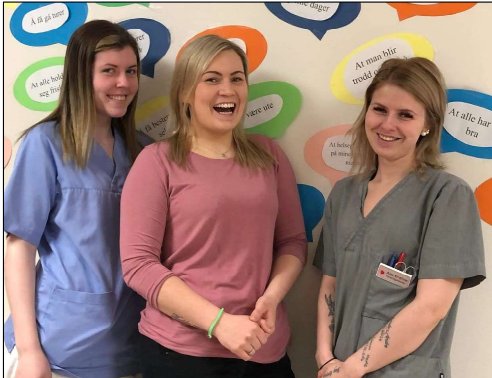
Hva er viktig for deg-dagen i juni ble markert.