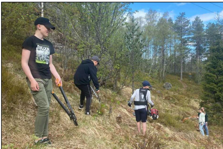
Skogrydding med flinke ungdommer og Heilt Innafor.

Året har i stor grad vært preget av koronarestriksjoner og mange avlysninger. Dette er spesielt uheldig når det rammer barn og unge. Heilt innafor har fått til mye i andre halvdel av året. Det er gledelig at samtlige tre ungdomsklubber er i drift og har god oppslutning.