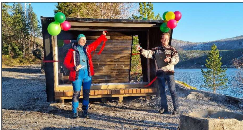
Ny og flott gapahuk ved Mørsviknes ble innviet i oktober.

Fiske-, vilt- og friluftslivsfondene er utlyst i én søknadsomgang i 2021. Det ble tildelt i alt kr. 193 000 til 6 tiltak. Det er utbetalt kr. 143 000 til 6 tiltak, der en av utbetalingene var knyttet til bevilgninger fra tidligere år.