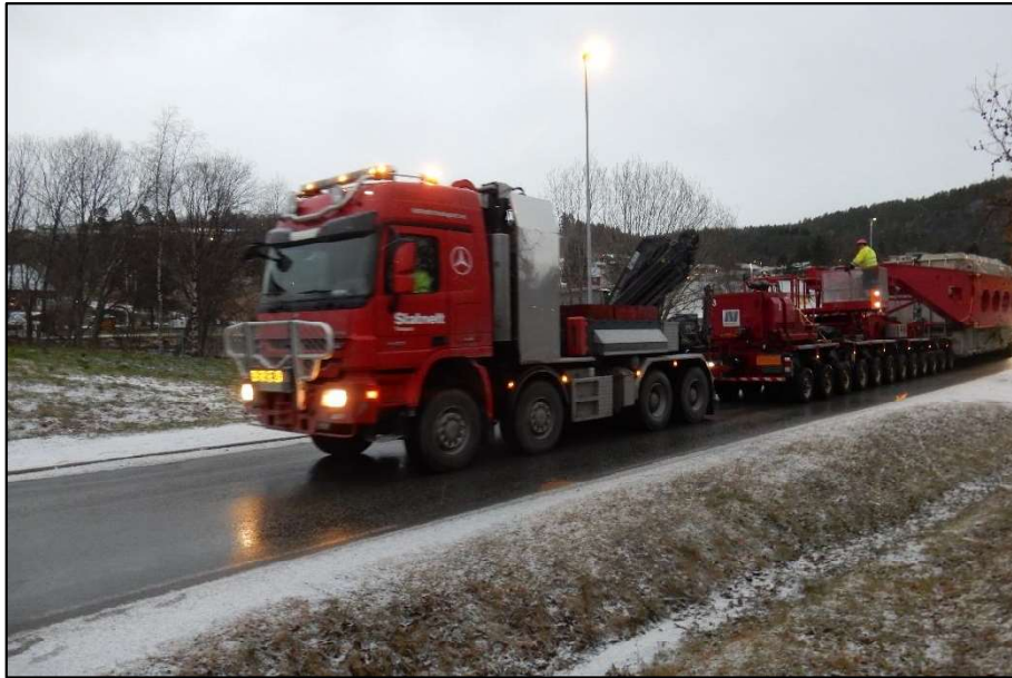
Til denne spesielle transporten måtte det lages ny midlertidig vei mellom E6 og Rødåsveien.

Oppfølging av reguleringsplanprosesser er et omfattende og tidkrevende arbeid.