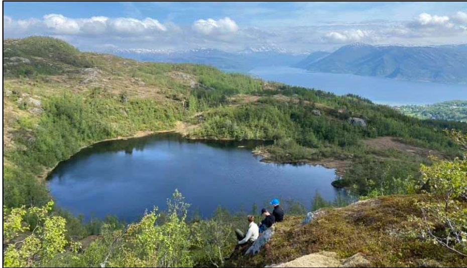
Flott turterreng i nærmiljøet.

Da malte de og utsmykket veggene med egenproduserte linoleumstrykk. Alle elevene på ungdomsskolen var innom dette prosjektet, og dette har bidratt til at de har fått et eieforhold til klubblokalene. Uttrykket «Å lage gull av gråstein» er beskrivende for prosjektet.