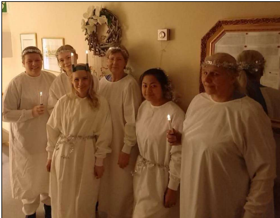
Lucia-markering på Sjøfold eldrecenter.