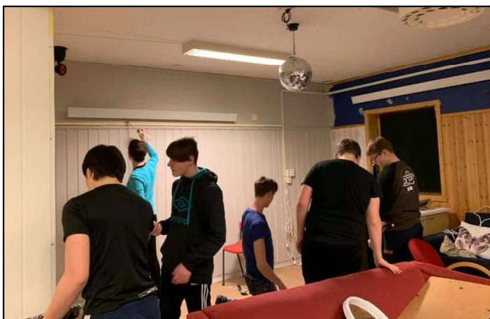
Klubblokalene pusses opp.

Ungdomsskolen har dette året hatt spesielt fokus på skole- og læringsmiljøet. Gjennom året har vi derfor hatt både små og store aktiviteter, men den største av dem alle var renovering av ungdomsklubbens lokaler. Gjennom prosjektet ønsket vi å skape et godt fysisk og psykososialt miljø, å praktisere elevmedvirkning, demokrati og medborgerskap.