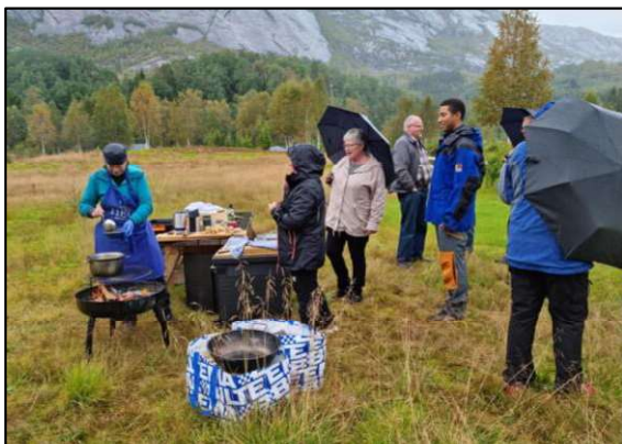
Heges Matopplevelser serverte en smak av Rago under jubileumsfeiringen 4. september.

Sørfold kommune har deltatt i arbeidet i regi av Midtre Nordland Nasjonalparkstyre, med forberedelse og gjennomføring av 50-års jubileet for Rago nasjonalpark i 2021. Prosjektet ble preget av covid19, og flere arrangement ble avlyst eller flyttet.