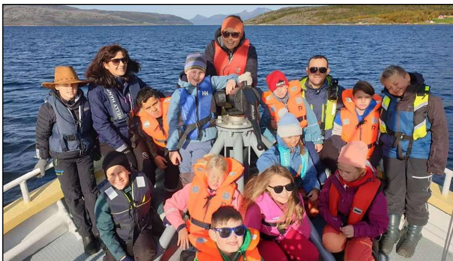
Tur med veteranbåt til Rørstad.

For voksenopplæringen har det vært varierende aktivitet dette året, noe som skyldes både korona og oppmøtet på skolen. Begge deler er utfordrende, men elevene er motiverte og kommunikasjonen god. Målet er å få elevene kvalifisert til jobb og oppholdstillatelse, og for noen statsborgerskap, og så langt ser det ut til at vi har lyktes med det.