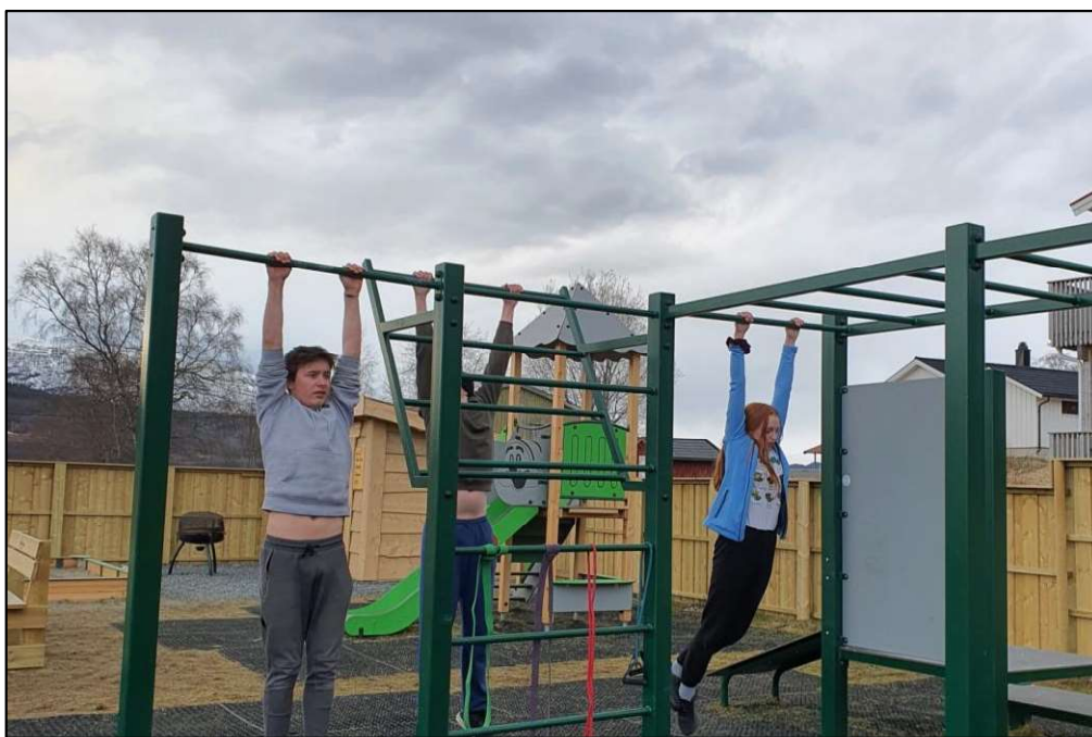
Myre aktivitetspark er mye i bruk, og dette er gledelig. Tilrettelegging for uorganisert aktivitet er viktig.

Ellers når det gjelder folkehelseiltak, ble aktiviteten begrenset av pandemien. Som i 2020 ble det lagt ut påskequiz-løyper flere steder i kommunen med god oppslutning.