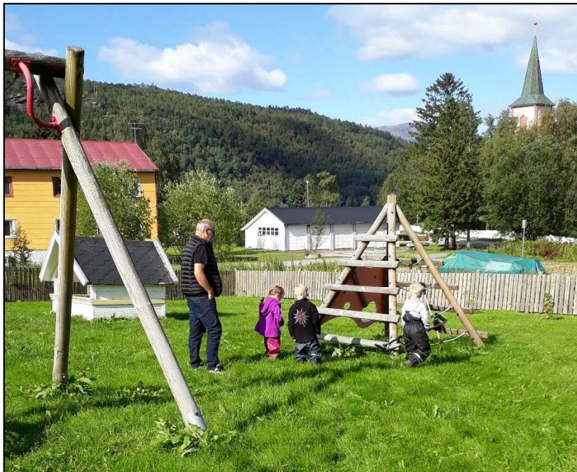
På jakt etter skjulte skatter i barnehagen.

I 2021 har vi gjennom Salten friluftsråd startet et samarbeid med barnehager og skoler fra Storuman i Sverige. Vi har hatt en felles samling på Storjord for å finne ut hvilke temaer vi ønsker å satse videre på. Veldig interessant med erfaringsutveksling, høre hvordan andre barnehager jobber både i forhold til kosthold, fysisk aktivitet, samisk perspektiv og barnehagens uteområde.