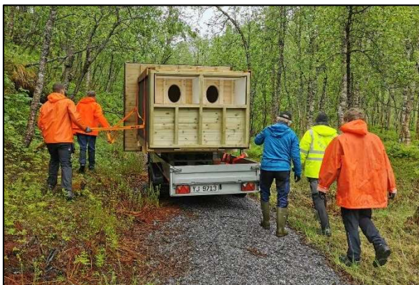
Ny utedo ved husmannsplassen Kjelvik fraktes på plass.

I 2021 fikk kommunen inn 19 søknader om tilskudd til tiltak i UKL-området. Til sammen hadde søknadene et totalt kostnadsbeløp på kr 2 996 278 og det ble søkt om kr 1 770 490 i tilskudd. Det ble til sammen innvilget kr 1 362 644 i tilskudd til ulike tiltak i området. Hele den tildelte rammen til UKL-området, samt de inndradde midlene ble dermed brukt.