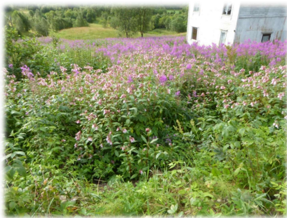
Figur 7: Kjempespringfrø i Gyltvik.

Framover vil det være aktuelt å kombinere de ulike tilskuddsordningene, for å få en best mulig bekjempelse av de uønskede artene. Arbeidet er krevende, og en er avhengig av lokal interesse og at en har noen som kan administrere og følge opp bekjempelsen.