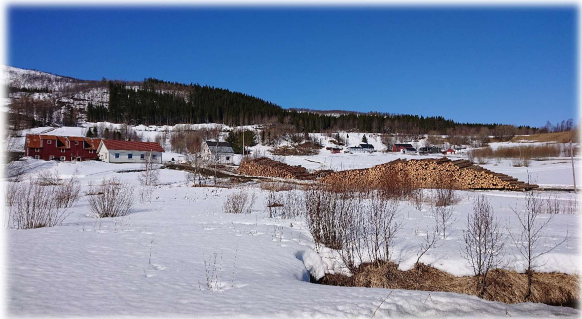
Figur 14: Hogst av plantefelt i Ånsvik.

Det er bygd en god del skogsveier i kommunen, men det er fortsatt et stort behov for veibygging, da en stor del av skogarealet består av et forholdsvis bratt og vanskelig terreng. Byggingen er dominert av traktorveier, pga. at det fremdeles er forholdsvis begrenset hogstvolum knyttet til veiene, med bjørkeskog og ung granskog. Det er ikke utarbeidet en hovedplan for skogsveier i kommunen. Et rasjonelt skogsveinett er en forutsetning for å kunne avvirke skogen på en lønnsom måte. Skogsveibygging kan komme i konflikt med miljø- og friluftsinnteresser, men skogsveier gjør også at utmarka blir lettere tilgjengelig for turgåere. Kommunene forvalter forskriften om godkjenning av planer for landbruksveger, og fra 01.01.2020 er også tilskuddsforvaltningen for skogsveier overført til kommunene. I forvaltningen av tilskuddsmidlene er det viktig å kanalisere midlene til de vegene som gir størst transportgevinst for skogbruket. Det vil i praksis si veier av bilveistandard og et ressursgrunnlag med granskog som enten er hogstmoden eller vil bli hogstmoden i løpet av en tiårsperiode.