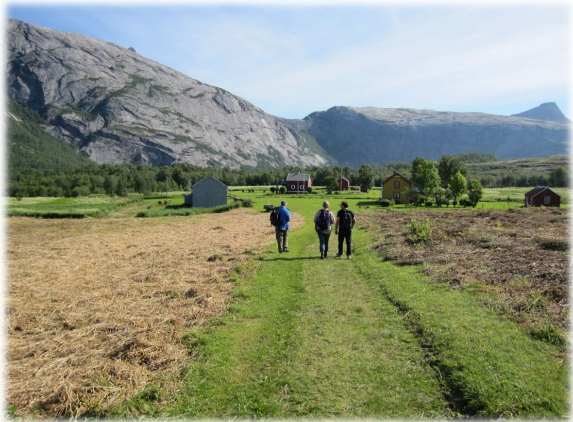
Figur 82: Rørstad

Dagens praktisering av konsesjon, driveplikt og deling av eiendommer ser ut til å ha en akkumulerende effekt for eiendomsstrukturen. En strengere praktisering av lovverk kan bidra til å hindre noe av utfordringene knyttet til eierforhold og fritidseiendommer.