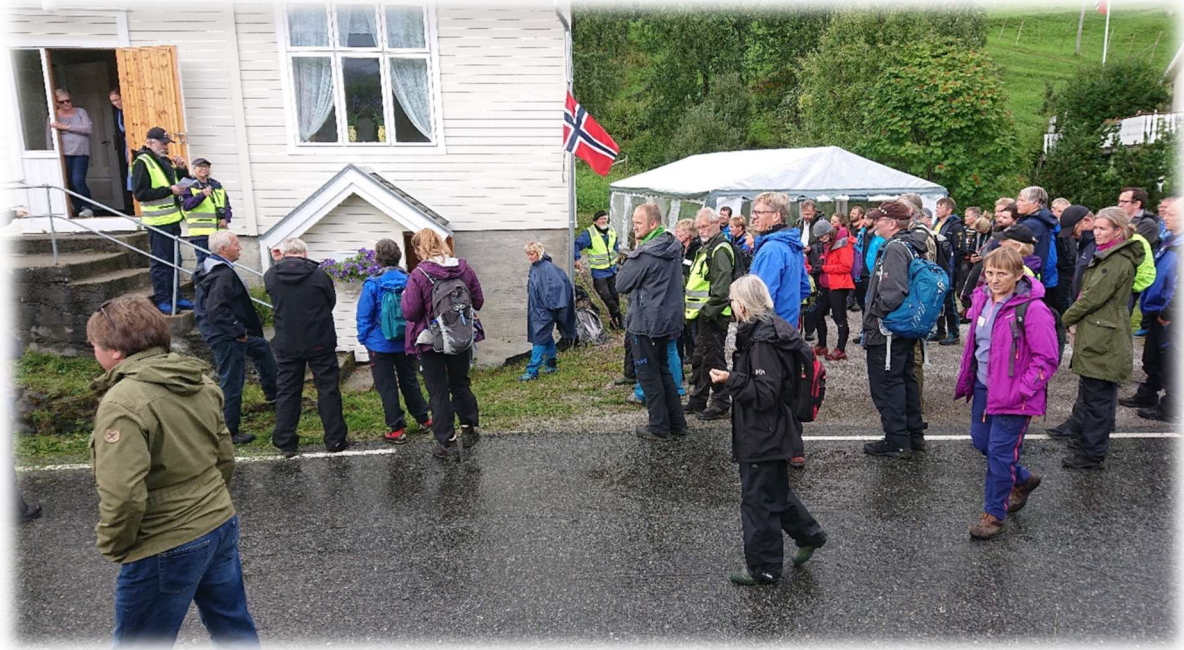
Figur 9: Utferdsdag i forbindelse med nettverkssamling for UKL-områder i 2018. Samling fremfor grendehuset på Engan.

Sørfold kommune overtok i 2020 forvaltningen av Utvalgt kulturlandskap i jordbruket fra Statsforvaltereni Nordland. Dette innebærer også forvaltning av de økonomiske virkemidlene knyttet til tiltaket. For 2023 utgjorde dette kr 620 000.