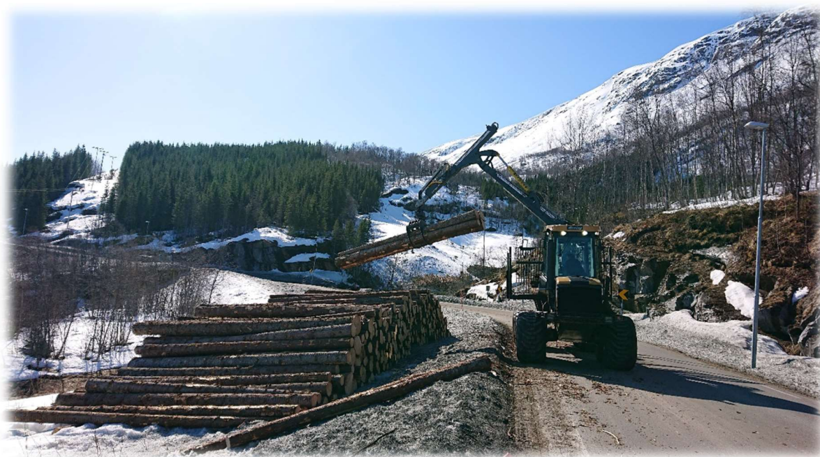
Figur 17: Lastbærer i sving i Ånsvik.

Tiltakshaver plikter å følge vilkår nedfelt i vedtaket om byggetillatelse, som hogstmengde, skogkultur og vedlikehold. Dersom dette ikke etterfølges, kan tilskuddet kreves tilbakebetalt.