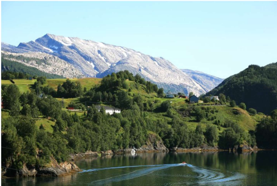
Figur 8: Utsyn mot Ørnesmoen. Fjordlandskapet i Engan og Ørnes holdes åpent gjennom beiting, slått og ryddig av gjengroingsmark.

Gjennom beiting, slått og ryddig av gjengroingsmark ivaretas landskapet og de biologiske verdiene.