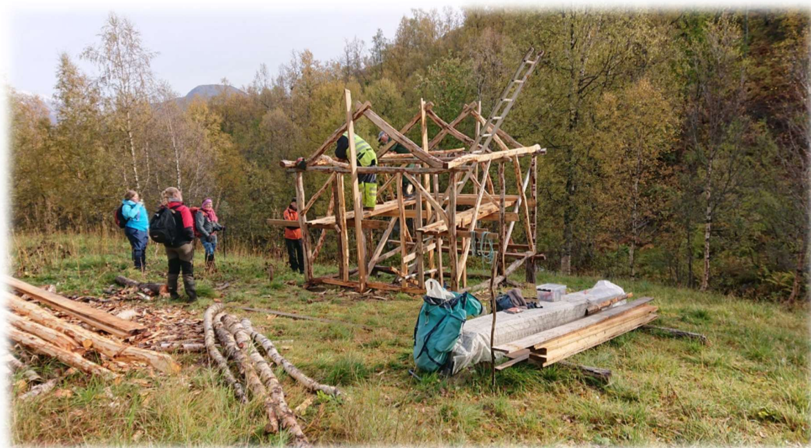
Figur 13: Sjytte under bygging i Kjelvik.

For særskilte tiltak for å ivareta biologisk mangfold, kan det ytes tilskudd med inntil 100% av godkjent kostnadsoverslag.