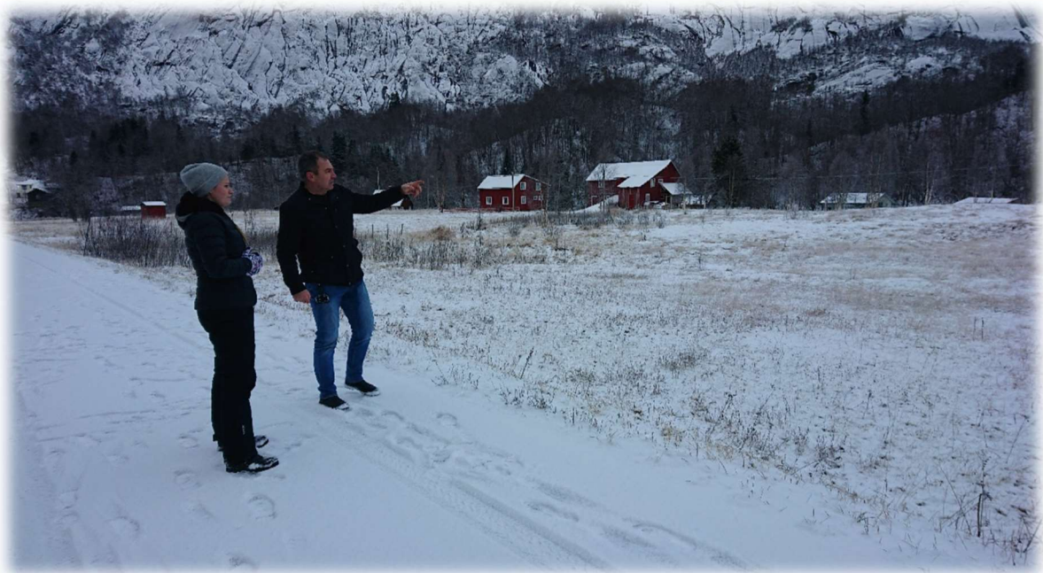
Figur 6: Lokalt verdifullt jordbrukslandskap i Nordfjord.

For alle områdene er det av stor betydning for både fastboende og tilreisende at landskapet holdes åpent og i produksjon.