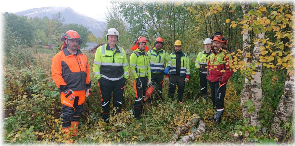
Figur 106: Aktivt Skogbrukskurs 2020.

Inntil 50% tilskudd av godkjent kostnad. Skal forhåndsgodkjennes av kommunen.