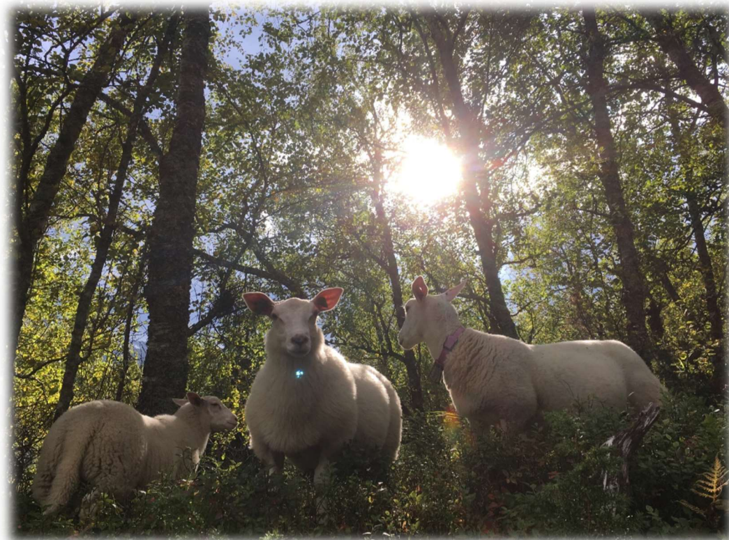
Figur 10: Sau på beite.

Sørfold kommunes utfordringer i jordbruket er ikke relatert til forurensingsproblem, men til gjengroing.