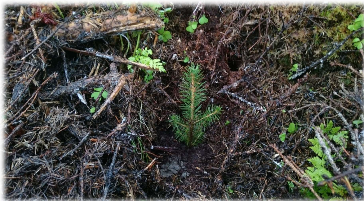
Figur 95: Nyplanting etter hogst.

For suppleringsplanting kan det innvilges tilskudd på inntil 100 % både for tidligere barskogareal og skogreisingsareal. Plantingen skal godkjennes på forhånd.