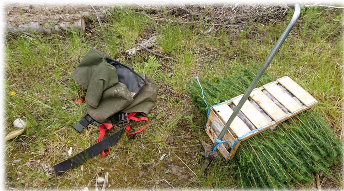
Figur 2: Klar til planting!

Det kan gis tilskudd til takst for en enkelt skogeiendom, takst for flere skogeiendommer, områdetakst og kursdeltakelse. Tilskuddssatser fastsettes av Statsforvalteren.