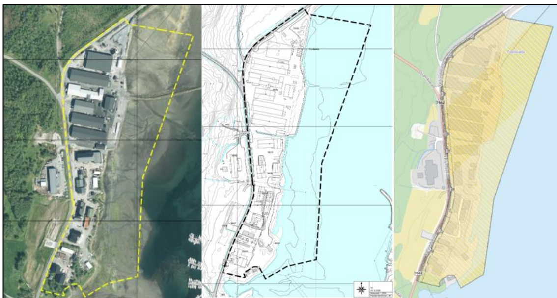
Figur 3 Dokumentasjon mottatt 19.01.2021 første bilde - planavgrensning fra planforslaget, andre bilde - plankart i pdf-format og tredje bilde - planavgrensning Sosi-format).

Planforslaget er lagt inn i forslagsbasen og oppdatert i planregisteret med innkommet per 19.01.2021, se figur 3. To første bilder - planavgrensning fra planforslaget og plankart i pdf-format og til høyre planavgrensning Sosi-format.