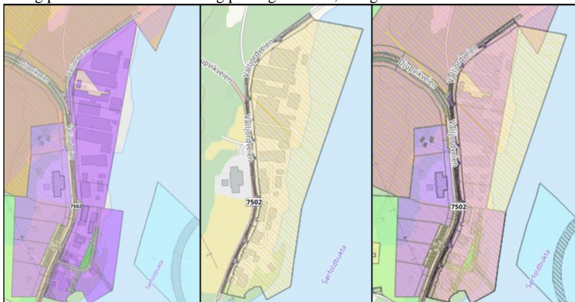
Figur 2 Planoversikt: første til venstre eksisterende, andre bilde forslag til detaljregulering Trollbukta industriområde planID 2020002, tredje bilde – planforslag med eksisterende planer.

Riktig plankart av eksisterende og planlagt område, se figur 2.